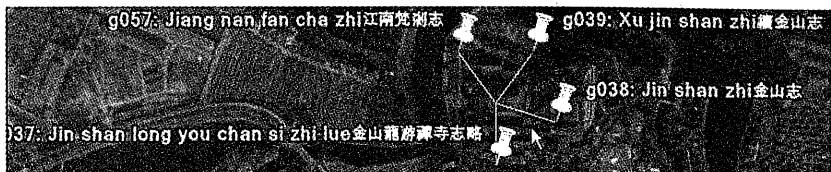
图二 ZFSH 论及金山寺的寺志

藏的寺志描述将达到 400 至 500 座佛寺。其中百分之五十分布在长江下游(江苏、浙江与安徽)。